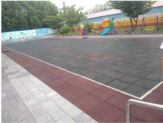
Creche na fábrica