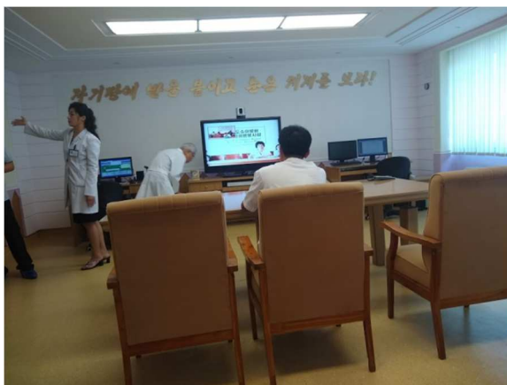
Sala de teleconsultas

encarregada de uma parcela específica da população, oferecendo para esta visitas regulares, consultas, exames e vacinações, ao mesmo tempo em que estimula a higiene e a prevenção de doenças, estimulando o aperfeiçoamento das condições sanitárias do povo. Desde a libertação do país a expectativa de vida da população quase duplicou, sendo àquela época de 38 anos (YON et al., 2018). Visitamos o hospital da Criança Okryu, situado em frente ao Hospital da Maternidade de Pyongyang. Para além de suas amplas instalações físicas, o hospital possui uma sala de teleconsulta que permite o atendimento de mais de 200 pequenos postos espalhados pelo país, otimizando recursos e garantindo ao interior o acesso aos melhores profissionais da área (HYOK, 2017).