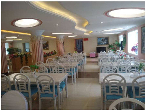
Espaço de festas