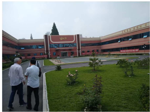
Quadra de volei

A questão agrícola possui enorme centralidade para a manutenção do bem-estar da população. Detendo menos de 20% de terras agricultáveis, inverno rigoroso e frequentes estiagens (abaixo, consta foto dos rios em pleno verão) a Coreia do Norte enfrentou diversas adversidades até chegar ao atual nível de desenvolvimento de sua agricultura. Logo após a libertação do país, foi realizada uma ampla reforma agrária que ensejou a instalação cooperativas agrícolas por todo o campo (YON et al., 2018). Desde então, enormes têm sido os esforços para o aumento da produtividade, de forma a sanar eventuais problemas de abastecimento de alimentos para as cidades. As dificuldades da produção agrícola se fizeram sentir com mais força na década de 1990, durante a chamada “Marcha Penosa”. Neste período, o país sofreu não apenas com isolamento internacional decorrente de derrocada de substanciais setores do campo socialista, mas também com o falecimento de seu grande líder Kim Il Sung e com calamidades como grandes enchentes, em 1995 e 1996, e um verão de forte seca, em 1997 (VISENTINI et