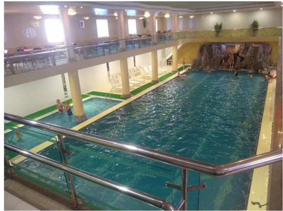
Piscina do prédio dos funcionários